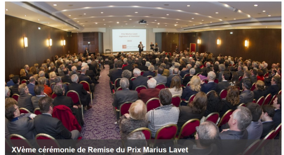
XVème cérémonie de Remise du Prix Marius Lavet

Le 14 mars 2016 était organisée dans le cadre de la Semaine de l'Industrie à la Maison des Arts et Métiers (Paris), la remise du Prix Marius Lavet, Ingénieur et Inventeur et du Prix Norbert Ségard du jeune espoir 2016 présidée par Francis MER, Industriel, ancien Ministre de l'économie, des finances et de l'industrie.